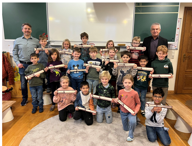
Text und Bild: Karin Sporer

Ein herzliches Dankeschön an die Sparkasse Nordschwaben!