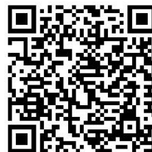
2026-03-11_QRCode_MS_Bewegung Schwangersch 11März