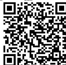
2026-03-18_QRCode_ChK_SüßKunterbunt 18März 19 Uhr