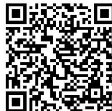
2026-03-12_QRCode_MS_Bewegung bewegt alles 12März