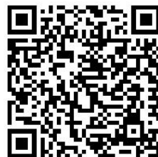
6-02-09_QRCode_JH_3-5Mon Präsenz DLG 9Feb